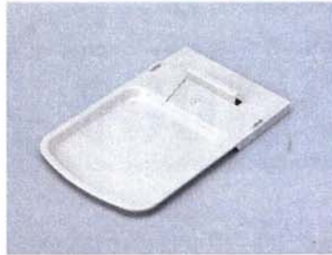
ถาดรอง Tray Type A

อุปกรณ์เสริม เมื่อไม่สามารถติดตั้งหรือวางตั้งโต๊ะได้ (อุปกรณ์ขาตั้ง (Type B) แยกจำหน่าย)